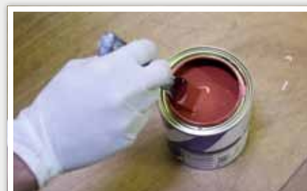
3 Mélanger la peinture à l'aide d'un mélangeur.