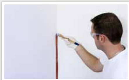
1 Rechampir* les angles de la pièce.

Utilisez une peinture adaptée à l'usage de la pièce (chambre ou salle de bain...) et à l'aspect souhaité de la finition (mat, velouté, satiné, brillant). Pour obtenir un résultat satisfaisant, utilisez un adhésif de masquage. Reportez-vous à la fiche 2.