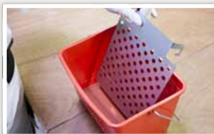
5 Ajouter la grille d'essorage qui permet de charger uniformément la quantité de peinture sur le manchon.