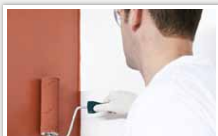
6 Appliquer une seconde couche.