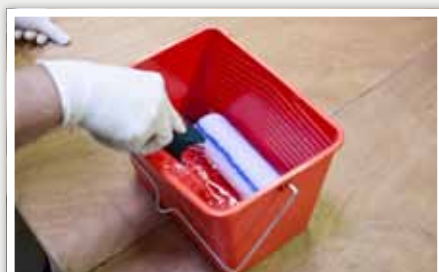
1 Humidifier le manchon avec de l'eau tiède.