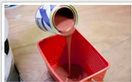
4 Après avoir vidé l'eau du camion, verser la peinture.