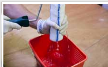
2 Bien essorer avant application.