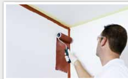
2 Déposer la peinture sur le mur.

Appliquer de la peinture dans les angles ou sur les bords pour bien délimiter la surface à peindre à l'aide d'un pinceau rond pointu. Si nécessaire, utiliser un adhésif de masquage.