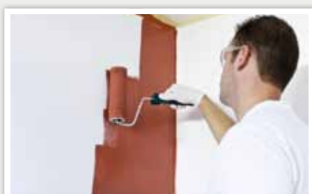
3 Répartir la peinture en croisant les mouvements.