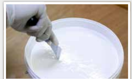
3 Mélanger la peinture à l'aide d'un mélangeur.