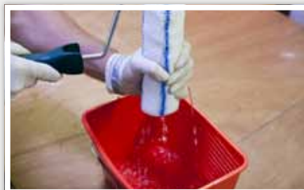
2 Bien essorer avant application.