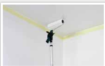
6 Appliquer une seconde couche. Les étapes à suivre sont identiques à la première couche.