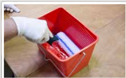
1 Humidifier le manchon avec de l'eau tiède.