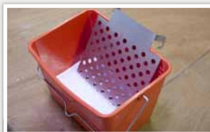
5 Ajouter la grille d'essorage qui permet de charger uniformément la quantité de peinture sur le manchon.