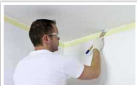
1 Rechampir* les angles.

Pour peindre un plafond, préférez une peinture mate qui réduit les défauts de relief. Toujours peindre dans le sens de la lumière du jour, c'est à dire à partir ou vers la lumière donnée par la fenêtre.