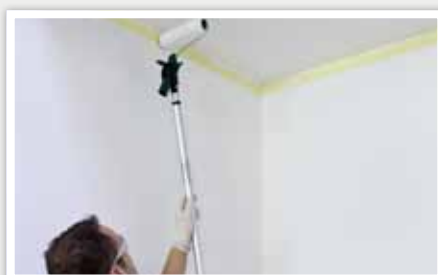
4 Lisser la peinture.