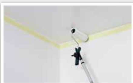
3 Répartir la peinture en croisant les mouvements.