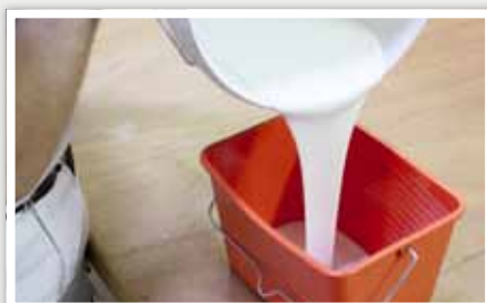
4 Après avoir vidé l'eau du camion, verser la peinture.