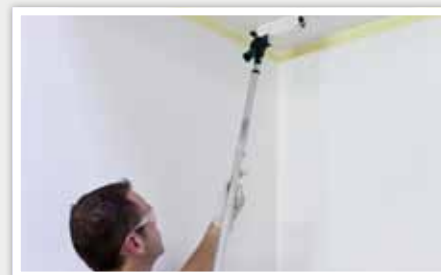
2 A l'aide d'une perche télescopique déposer la peinture sur le plafond.

Appliquer de la peinture dans les angles ou sur les bords pour bien délimiter la surface à peindre à l'aide d'un pinceau rond pointu. Si nécessaire, utiliser un adhésif de masquage.